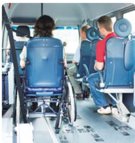
Im Boden integrierte Vierpunktrollstuhlfesthalterung. Dreipunkt-rollstuhlunabhängiger Sicherheitsgurt.