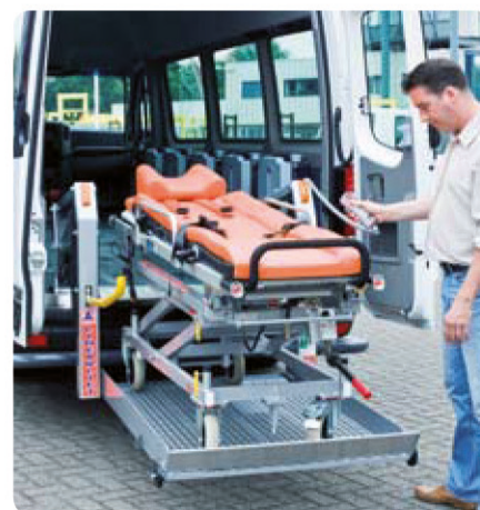
Zukunftsgeeignet. Sicher und multifunktional.