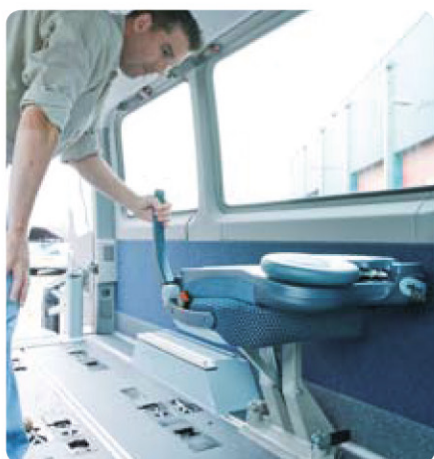
Ergonomischer Klappsitz mit Klicksystem. Antirutschboden.

Mit dem Flex-i-Trans-System® können Busse häufiger und vielseitiger eingesetzt werden, und somit ist es eine ausgezeichnete Investierung für Unternehmer im Beförderungsbereich. Aus unabhängigen Prüfungen geht hervor, dass die Handhabung des Flex-i-Trans-Systems® von den Fahrern kaum eine körperliche Anstrengung verlangt, und dass das System außerordentlich anwenderfreundlich ist.