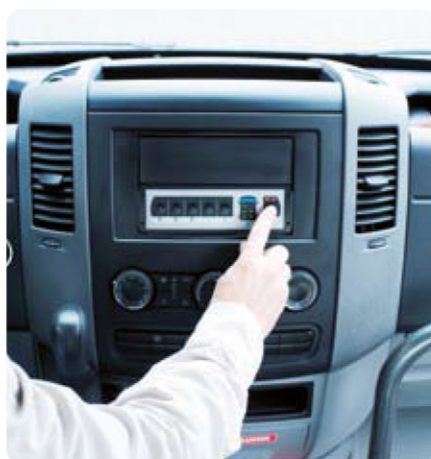
Alle Befestigungssysteme mit einem Griff gesichert. Keine losen Teile im Fahrzeug.